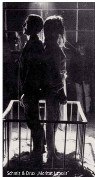
Schmiz & Drux „Moritat Latexis“